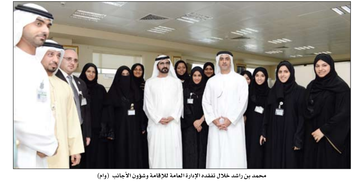
محمد بن راشد خلال تفقده الإدارة العامة للإقامة وشؤون الأجانب (وام)