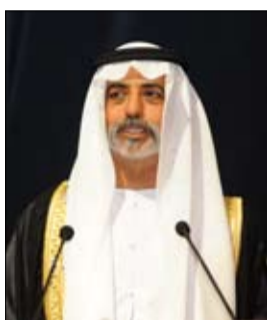
معالي الشيخ نهيان بن مبارك

تحت رعاية معالي الشيخ نهيان مبارك آل نهيان وزير الثقافة والشباب وتنمية المجتمع يعقد في العاصمة ابوظبي يوم السادس من سبتمبر ابيلول المقبل مؤتمر النور الدولي الاول للتمريض تحت عنوان التمريض الامن بناء وتعزيز للجودة والتميز بمقر كلية التقنية العليا للطالبات في ابوظبي والذي ينظمه مجموعة مستشفيات النور في ابوظبي بحضور عدد من مديري التمريض والاطباء والمختصين من وزارة الصحة وهيئة الصحة في ابوظبي وشركة ابوظبي للخدمات الصحية صحة ومدينة الشيخ من المحاضرين الدوليين. وأكد الدكتور قاسم العوم الرئيس التنفيذي لمجموعة مستشفيات النور رئيس المؤتمر على ان الخدمات التمريضية جزء اساس وهام في تقديم الخدمات الصحية المكتملة وان توفير خدمات تمريضية ذات مستوى عال و متميز من شأنه ان يبرز من مستوى الخدات الصحية