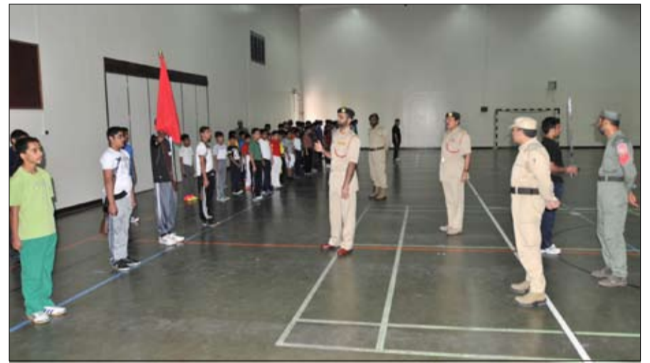
تواصل فعاليات الحملة المرورية صيف بلا حوادث بالفجيرة