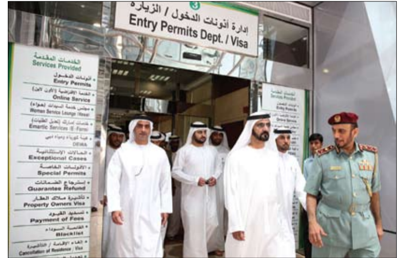
تفقد الإدارة العامة للإقامة وشؤون الأجانب